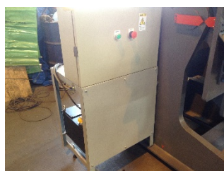
上段：制御装置 下段：油圧ポンプ