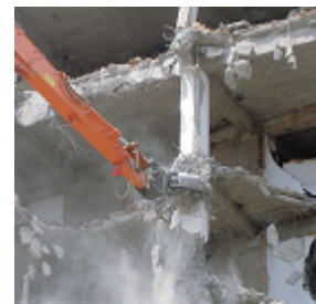
GUZZILLA 大割機DS Aタイプ/360° 自動旋回式(オートマ)仕様表