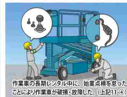
作業車の長期レンタル中に、始業点検を怠ったことにより作業車が破損・故障した。（上記11-④）