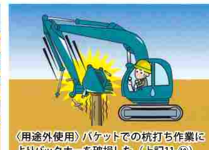
〈用途外使用〉バケットでの杭打ち作業によりバックホーを破損した（上記11-⑩）