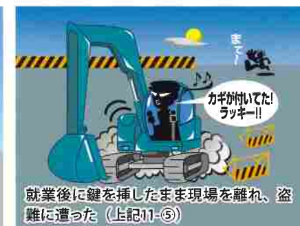
就業後に鍵を挿したまま現場を離れ、盗難に遭った（上記11-⑤）