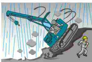
豪雨で地盤が悪くなりクレーンが転倒して破損した（左記10）