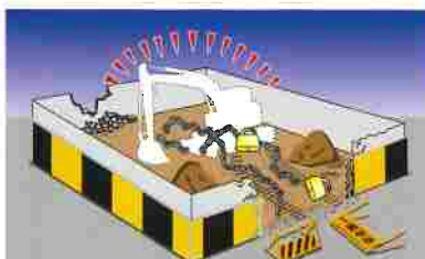
養生囲いで適切に施錠管理された作業現場からバックホーを盗難された（左記5）