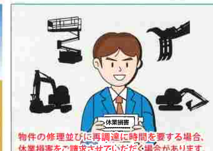
物件の修理並びに再調達に時間を要する場合、休業損害をご請求させていただく場合があります。