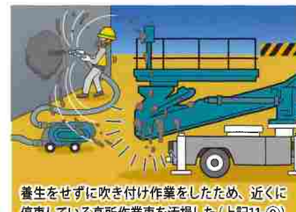
養生をせずに吹き付け作業をしたため、近くに停車している高所作業車を汚損した（上記11-⑨）