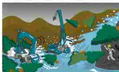
作業場に突然鉄砲水が押し寄せて重機が水没した（左記2）