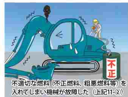
不適切な燃料（不正燃料、粗悪燃料等）を入れてしまい機械が故障した。（上記11-②）