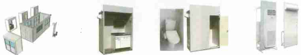
桁側も柱なしでどの位置にもお好みのユニットを搭載できます キッチンユニット トイレユニット (オプションユニット一部ご紹介) エアコンユニット

●お好みのパネルを搭載することにより事により、お客様が望む空間をご提供 多種多様なパネル・ユニットの取り付けが可能で、レイアウトは自由に変える事ができます。